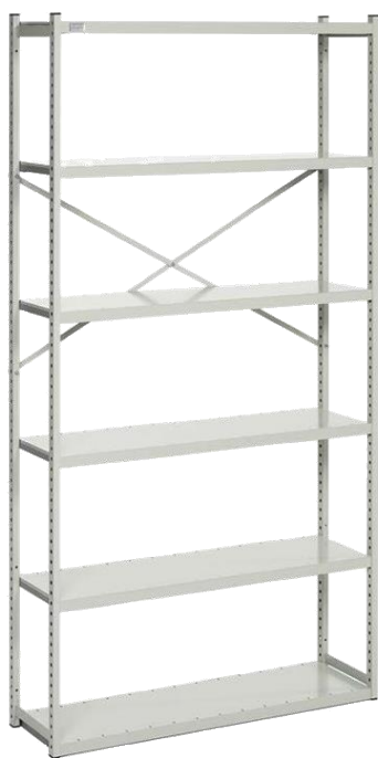
UNITE DE DEPART