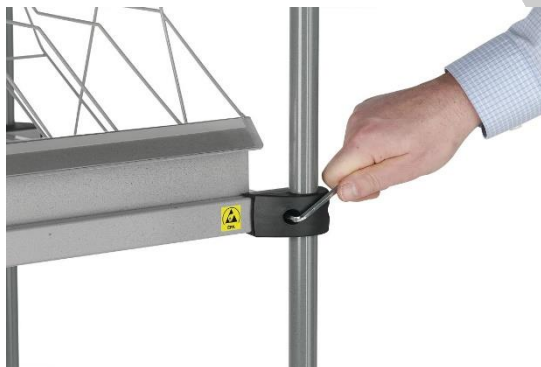
Structure du chariot (code 08-0110-00058)