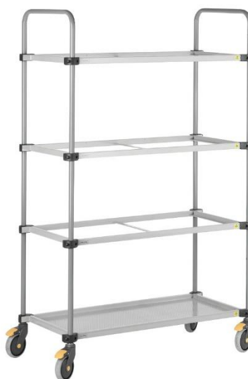
Porte-bobines (code 08-0110-00057)