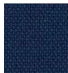
0502 (0402#) Indigo