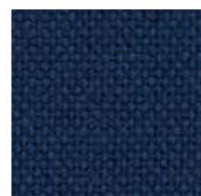
0502 (0402 € ) Indigo