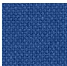
0504 (0404 € ) Corinth