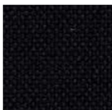
0511 (0411 € ) Black